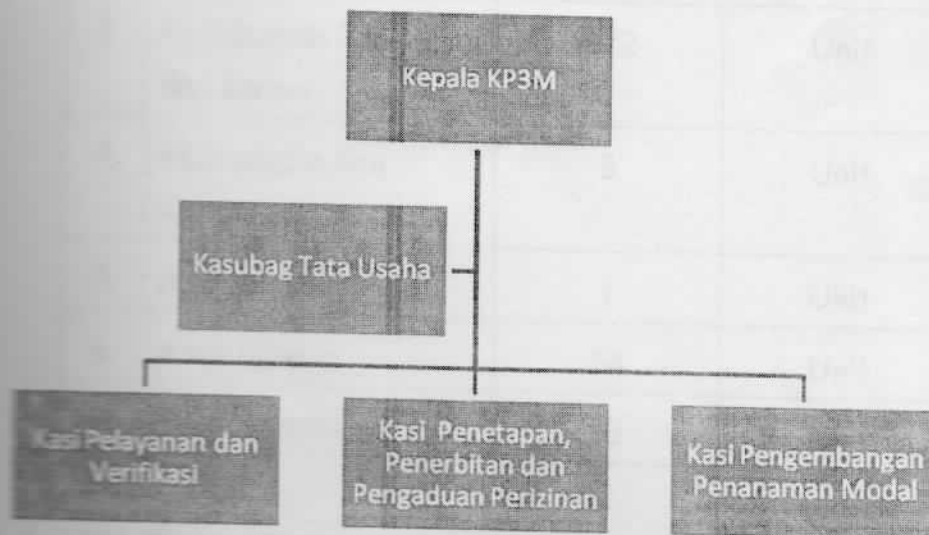
Gambar struktur organisasi KP3M

Organisasi Kantor Pelayanan Perizinan dan penanaman Modal Kabupaten Temanggung